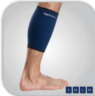
Supporto del polpaccio