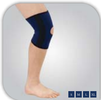
Supporto del ginocchio