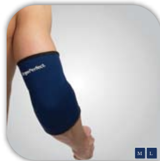
Supporto del gomito