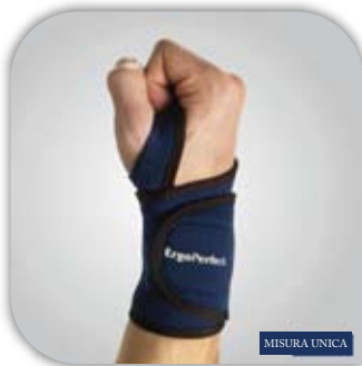
Supporto del polso