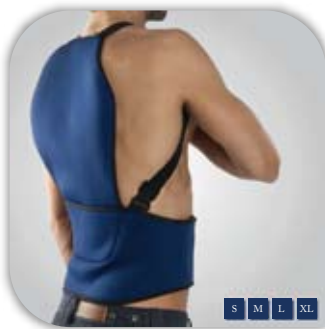
Supporto della schiena