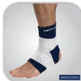
Supporto della caviglia