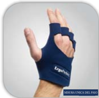
Supporto della mano

Ergonomic support of the body ErgoPerfect is perfect for use during work and other physical activities. Exceptional properties of the neoprene mix allow to maintain the heat, which improves the circulation of the blood, helps the muscles and joints to maintain their flexibility and supports medical treatment.